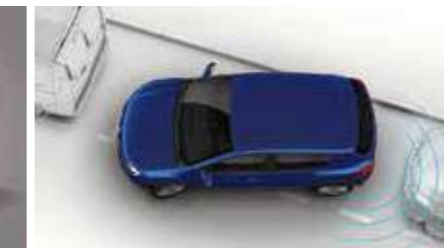
Fotos de referencia. Equipamientos según versión. *Accesorios y Servicios se venden por separado.